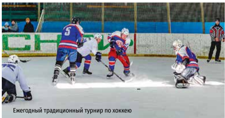
Ежегодный традиционный турнир по хоккею

— Руководство комбината «Электрохимприбор» на протяжении всей 75-летней истории нашего предприятия неуклонно придерживается установки: «Здоровый работник — эффективный работник». У нас прекрасно понимают, что когда человек полон сил и энергии, то и его вклад в работу более высок и значим. Именно поэтому в поддержке здорового образа жизни сотрудников, привлечении их к занятиям физкультурой и спортом мы видим одну из первоочередных задач при реализации социальной политики.