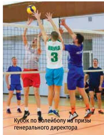
Кубок по волейболу на призы генерального директора