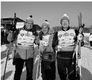
«Лыжня России» на ЭКСПО

— Достаточно часто. А всплеск таких обращений бывает после крупных побед российских спортсменов. Например, после проведения чемпионата мира 2018 года по футболу было много обращений с просьбами помочь отремонтировать действующий или построить новый стадион, поспособствовать в организации секций по этому виду спорта. Победы наших фигуристов на первенствах Европы и мира в последние годы вызвали массу просьб строить больше в городах и поселках области ледовых арен, пригодных и для хоккея, и для фигурного катания. А после блестящего выступления наших лыжников на Зимней Олимпиаде 2022 года, уверен, значительно возрастет интерес наших земляков к лыжному спорту. Традиционно много поступает также просьб о содействии в открытии новых центров тестирования ГТО в населенных пунктах.