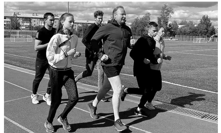
Новое поле и беговые дорожки на стадионе «Юность», г. Ирбит

— Спортом я занимаюсь с первого класса. Сначала — плаванием, затем увлекся хоккеем. А в четвертом классе к нам пришел тренер по конькобежному спорту, и я вплоть до окончания школы с удовольствием занимался этим видом спорта в спортобществе «Динамо», выполнил нормативы кандидата в мастера спорта. После школы поступил в Новосибирское высшее военное-политическое общеобразовательное училище, а там у нас был настоящий культ спорта. С него начинался каждый учебный день, особенно активно мы занимались лыжами: для курсантов установка была пробежать за сезон на лыжах «500 сибирских километров». Плюс офицерское многоборье, обязательные занятия по гимнастике, легкой атлетике, рукопашному бою... К тому же после училища я служил в ВДВ,