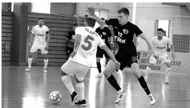
Лучшие моменты матча Синара — КПрФ

Только в феврале, к примеру, прошли отложенные аж с 7-го тура матчи Суперлиги между лидером нынешнего первенства страны «Тюменью» и «Синарой», действующим чемпионом России. Игры эти выявили большой интерес, ведь в составах соперников выступали и футболисты, которые только что прибыли из Амстердама, где в рядах российской сборной завоевали серебряные медали