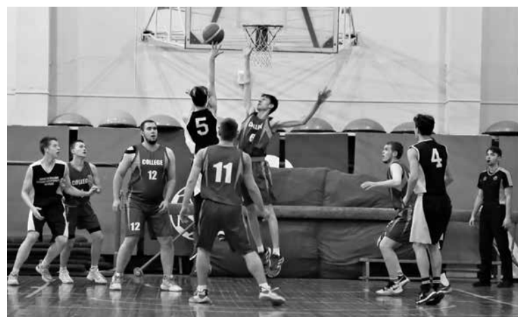
Баскетбольная команда ГАПОУ СО «НТПК № 2», студенты 1-3 курсов