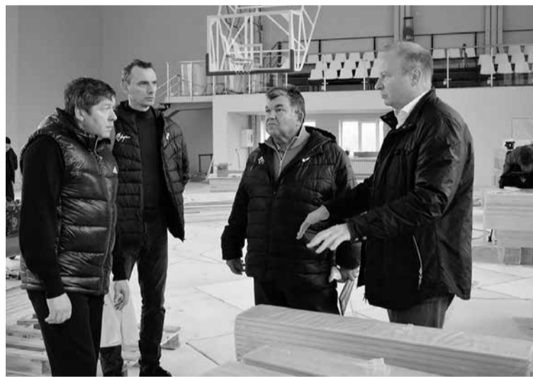
Ремонт спортзала стадиона «Юность», г. Ирбит

— Какова роль регионального отделения партии «Единая Россия» в организации спортивно-массовой работы в нашей области?