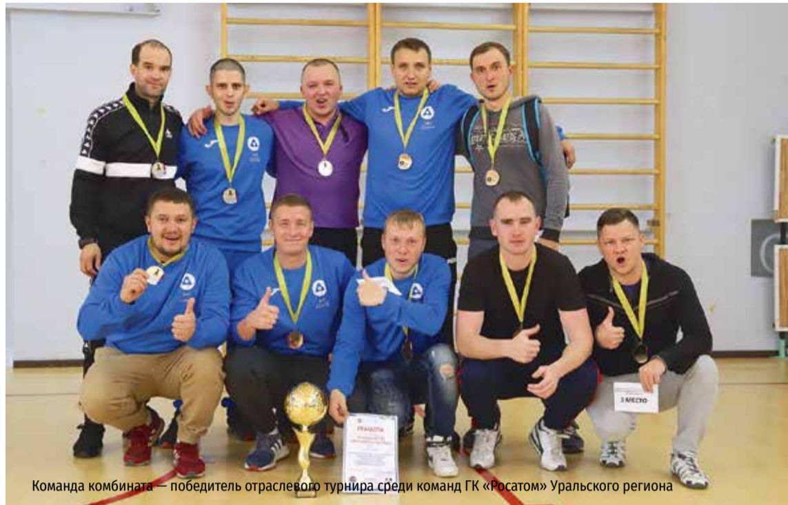
Команда комбината — победитель отраслевого турнира среди команд ГК «Росатом» Уральского региона

— На комбинате проводится немало спортивных мероприятий, самым масштабным и популярным из них стала Спартакиада трудовых коллективов предприятия, в этом году стартовавшая уже в десятый раз. На участие в ней обычно заявляются 24–26 коллективов физкультуры, а это — около двух тысяч человек. В течение всего года на спортивных площадках проходят состязания по 11 видам спорта — лыжным гонкам, шахматам, конькобежному спорту, дартсу, легкой атлетике, легкоатлетическому кроссу, волейболу, мини-футболу, настольному теннису, стрельбе,