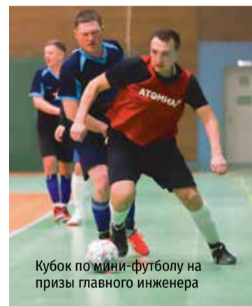
Кубок по мини-футболу на призы главного инженера

смены выступают на спортивных площадках МБУ «СШОР «Факел», с которым градообразующее предприятие связывают многолетние партнерские отношения. И там всегда готовы предоставить для соревнований работников комбината спортивные залы, стадионы, лыжную трассу, хоккейный корт, плавательный бассейн, каток и так далее.