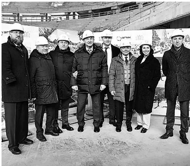
Участники выездного заседания Комитета Государственной Думы по физической культуре и спорту

Ресурсное обеспечение Программы составит 65,9 млрд рублей, из них федеральный бюджет — 21,3 млрд рублей, бюджет субъекта Российской Федерации — 43,8 млрд рублей, внебюджетные источники — 782,0 млн рублей.