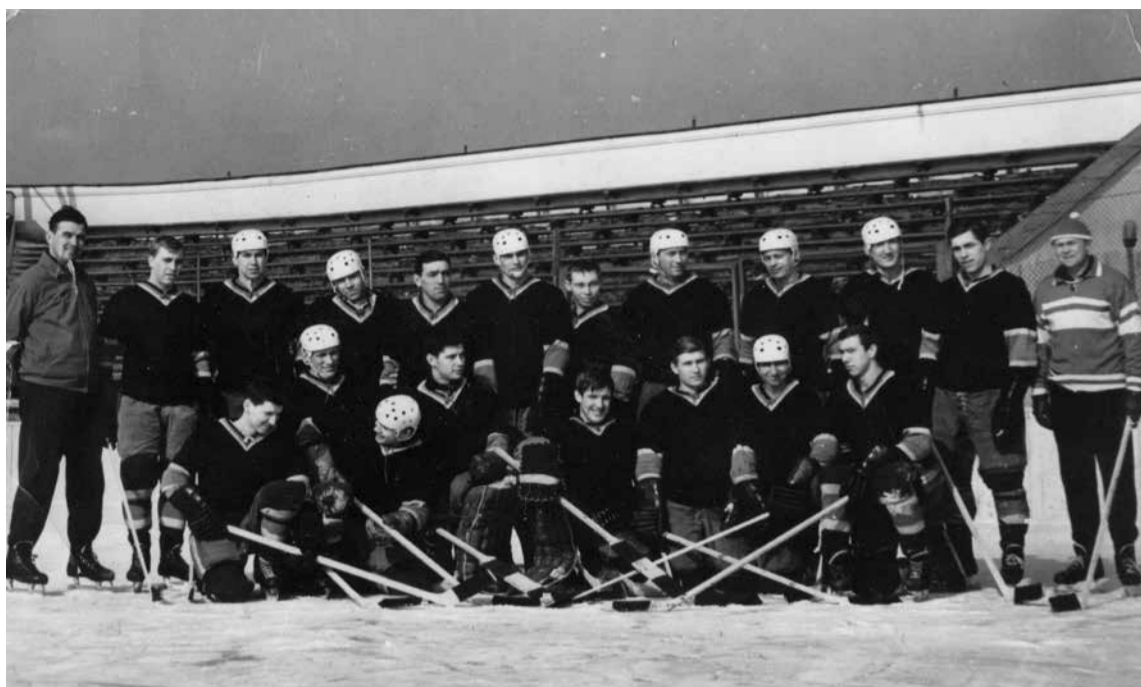
Спартак-Свердловск, 1964 г.

томобилиста» решило пойти в ногу со временем и оставить свой осязаемый след в истории развития делавшего тогда первые шаги в стране женского хоккея с шайбой. Пионером этого движения предложили стать мне. И я, перекрестившись, дал добро. Первым делом придумали команде название, суровое и задиристое — «Уральские ведьмы».